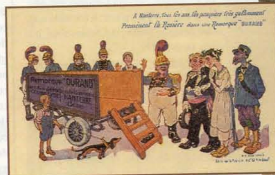
Au début du siècle, l'image des légendaires pompiers de Nanterre se retrouvait tant dans la caricature que dans la publicité. Et la chanson « Les pompiers de Nanterre » faisait partie du répertoire populaire lors des fêtes, bien au-delà des limites de notre commune.