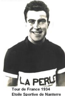
Tour de France 1934 Etoile Sportive de Nanterre