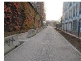
Une vue actuelle de la future rue Monique-Hervo

Rappelons qu'une rue de Nanterre sera prochainement inaugurée, dans le nouveau quartier des Groues, pour honorer la mémoire de Monique Hervo. De son côté, la Contemporaine prévoit une grande exposition sur les engagements, le travail et les archives de la militante, en 2026-2027.