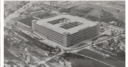
Vue aérienne de l'usine Donnet en 1929.