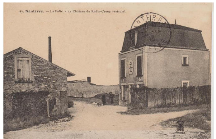
Les Tris-Goujats – Le Château de Radis Creux