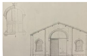
(dessin de Morgana Borrull)

Le vendredi 29 mai encore , nous exposerons la maquette du bourg de Nanterre au XVII e siècle , réalisée dans le cadre des budgets participatifs de la ville, à partir du plan terrier de 1688, sur la place du marché en fête (de 17 h à 21 h 30).