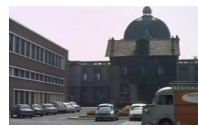
Cliquer sur le lien associé à cette photo du film