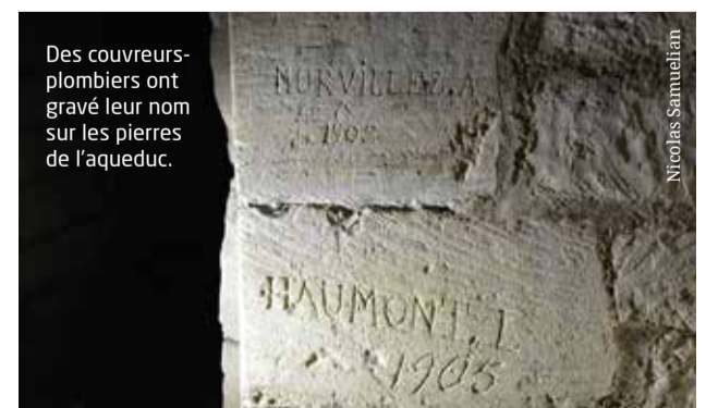
Des couvreurs-plombiers ont gravé leur nom sur les pierres de l'aqueduc.