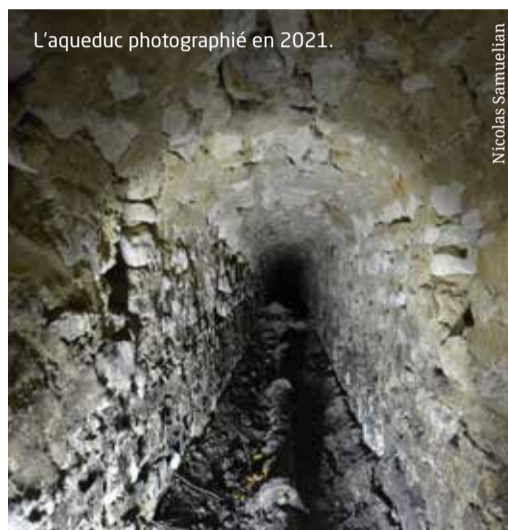
L'aqueduc photographié en 2021.

Le projet nécessite l'achat de terrains et la destruction de maisons. Son installation dans un bourg aux dimensions modestes est une révolution urbaine, économique et sociale.