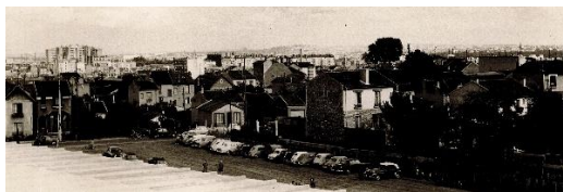
Cliquer sur cette image