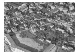
Remonter le temps

pour voir une petite animation proposée par C. Fauvellière