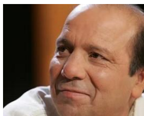
à Charef, à Paris le 28 février 2006.

Mehdi Charef est décédé le 9 juin. De nombreux hommages, auxquels nous sommes associés, ont été rendus à l'écrivain et au cinéaste. Nous gardons de lui le souvenir d'un ami fidèle de la Société d'Histoire, de sa disponibilité et de sa grande gentillesse, à chaque fois que nous l'avons sollicité, de ses évocations partagées du bidonville au Petit-Nanterre, de la cité de transit de la rue de Valenciennes, de sa scolarité ...Son roman, Rue des Pâquerettes (2019), est un de nos « best-seller ». En 1988, son nom a été donné à l'une des salles du tout nouveau cinéma Les Lumières ; il y a quelques jours, le conseil municipal a décidé de donner aussi son nom à la médiathèque du Petit-Nanterre.